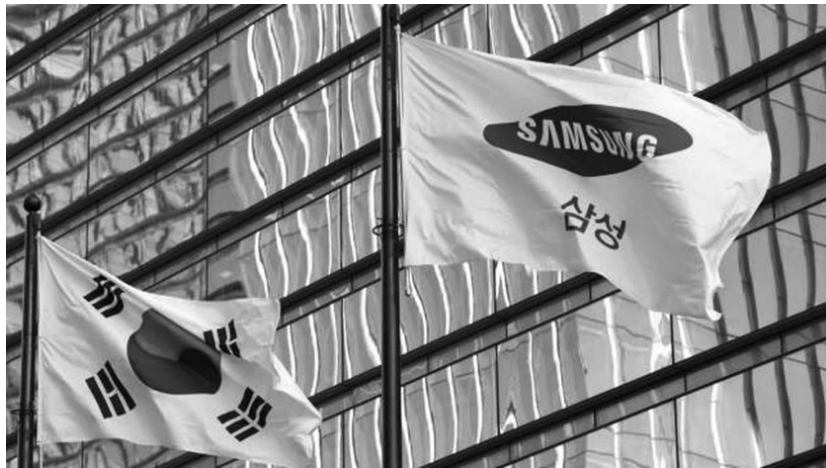
▲ 三星顯示與工會簽署薪資協議罷工活動落幕

南韓面板大廠三星顯示 (SamsungDisplay) 的工會罷工活動於週四 (8 日) 結束。工會幹部與資方代表在當天簽署了一份薪資協議，而這也是三星顯示創立以來的頭一次罷工活動。