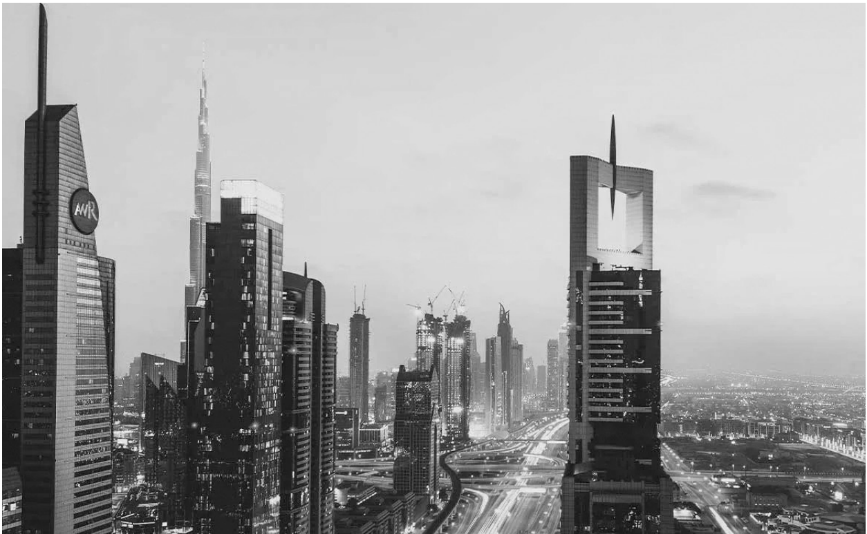
▲ 圖／pranjali srivastava@Pexels

與生活平衡、提高社會福利的努力」，也期望新的工作週期將「順利讓國家的金融、貿易和經濟交易更順利，為成千上萬的阿聯公司與跨國企業提供更強大的國際貿易機會。」