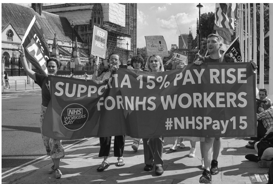
▲ 英國醫護人員上街抗議工資多年停滯，政府僅上漲3%。

英國醫護人員在新冠肺炎疫情期間，不但必須穿著全套防護裝備，休假也遭到取消，他們對當局提出加薪要求，前衛生部長漢考克3月時提議加薪1%。